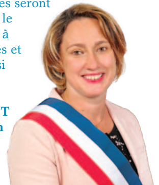
Murielle LAURENT Le Maire de Feyzin

50 jours après la présidentielle, les élections législatives seront organisées. Les 12 et 19 juin prochains, il faudra élire le député de la 14 e circonscription du Rhône qui siègera à l'Assemblée nationale. J'encourage toutes les électrices et tous les électeurs à prendre part à ce scrutin tout aussi important pour notre avenir !